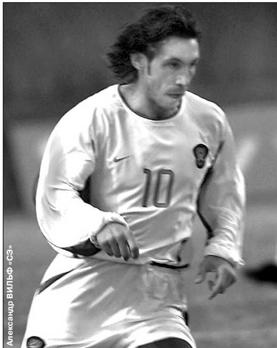
Александр Мостовой. «СЭ»

Женский футбол. Кубок России-2003. Ответный матч. Энергия Воронеж — Лада Тольятти — 1:2 (первый матч — 1:0). Благодаря большому числу голов, забитых на чужом поле, Кубок завоевала «Лада», сообщает корреспондент «СЭ» Алексей СЕРГУНИН.