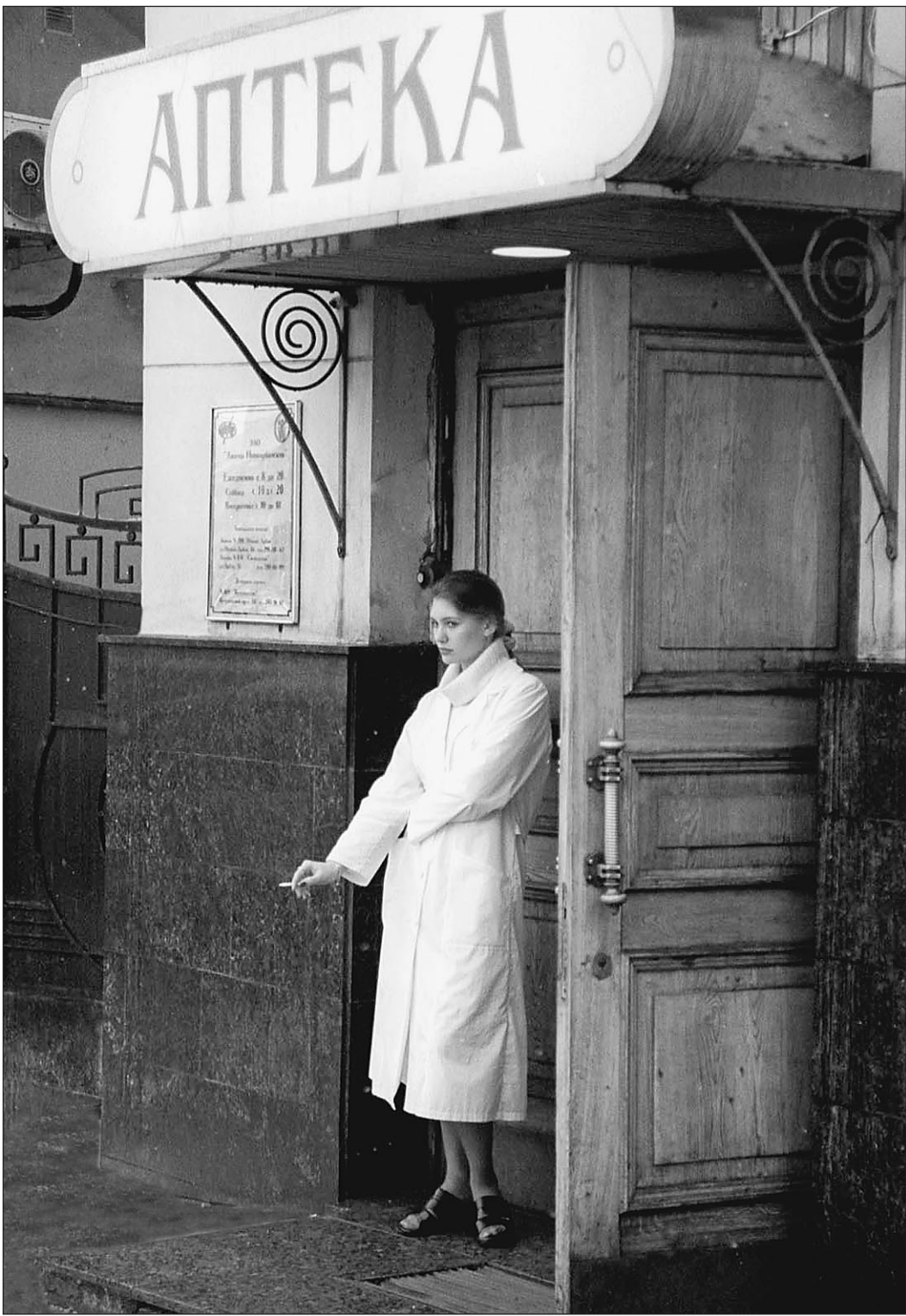
Двери российских аптек открыты для любых подделок

Урегулировать проблему поддельных лекарств, как показывает международный опыт, возможно — доля фальсификатов в развитых странах не превышает 2 процента. Но для этого надо работать, а не просто пугать народ страшилками об отраве.