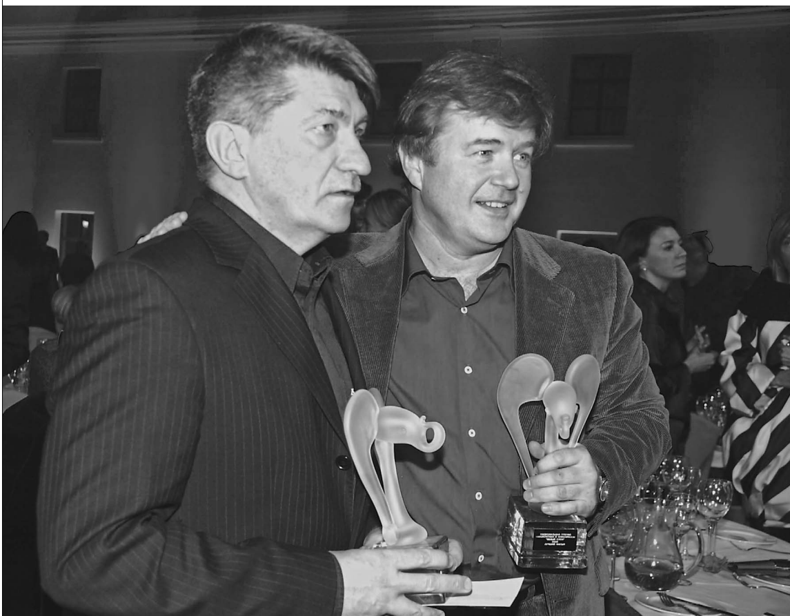
2006 год. Александр Сокуров и Андрей Сигле на церемонии вручения премии Гильдии киноведов и кинокритиков России «Белый слон»

Режиссер Александр Сокуров приступил к съемкам фильма «Фауст». Сценарий написал Юрий Арабов — при участии режиссера. Производство осуществляет петербургская студия «Пролайн фильм». Обозреватель «Известий» Вита Рамм побеседовала с генеральным продюсером фильма Андреем Сигле . → стр. 10