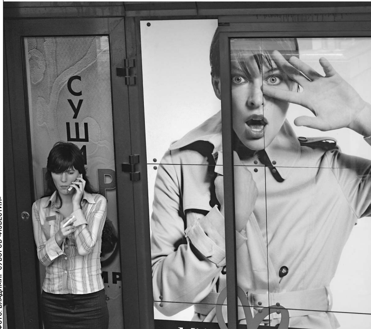
Тарифы на мобильную связь могут отбить аппетит у каждого