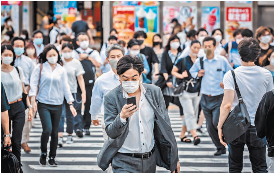
Людям, страдающим от одиночества, необходимо помогать устанавливать связи.

ПРАВО Верховный суд России защитил право человека на самооборону