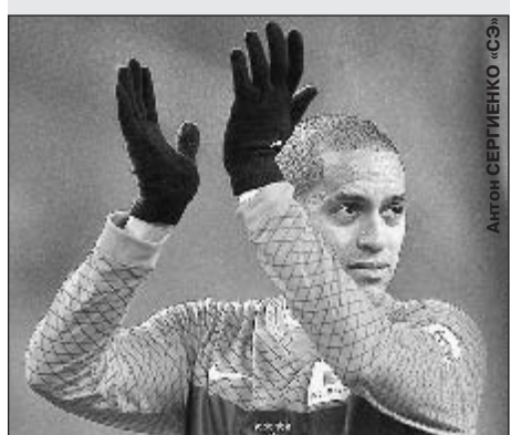
Александр СЕРГЕЕВ «СЭ»

Бразильский полузащитник красно-белых рассказал специальному корреспонденту «СЭ» о жизни в России, своем клубе, чемпионате мира и многом другом.