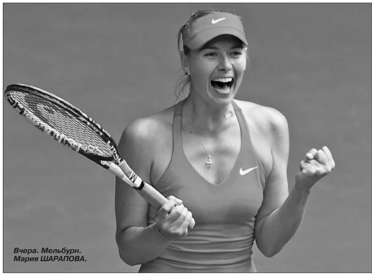
Вчера, Мельбурн. Мария ШАРАПОВА.

Вчера лучшая теннисистка России обыграла в полуфинале свою соотечественницу Екатерину Макарову (6:3, 6:2) и теперь в субботу в решающем матче сойдется с первой ракеткой мира Сереной Уильямс. Это будет их 19-я встреча.