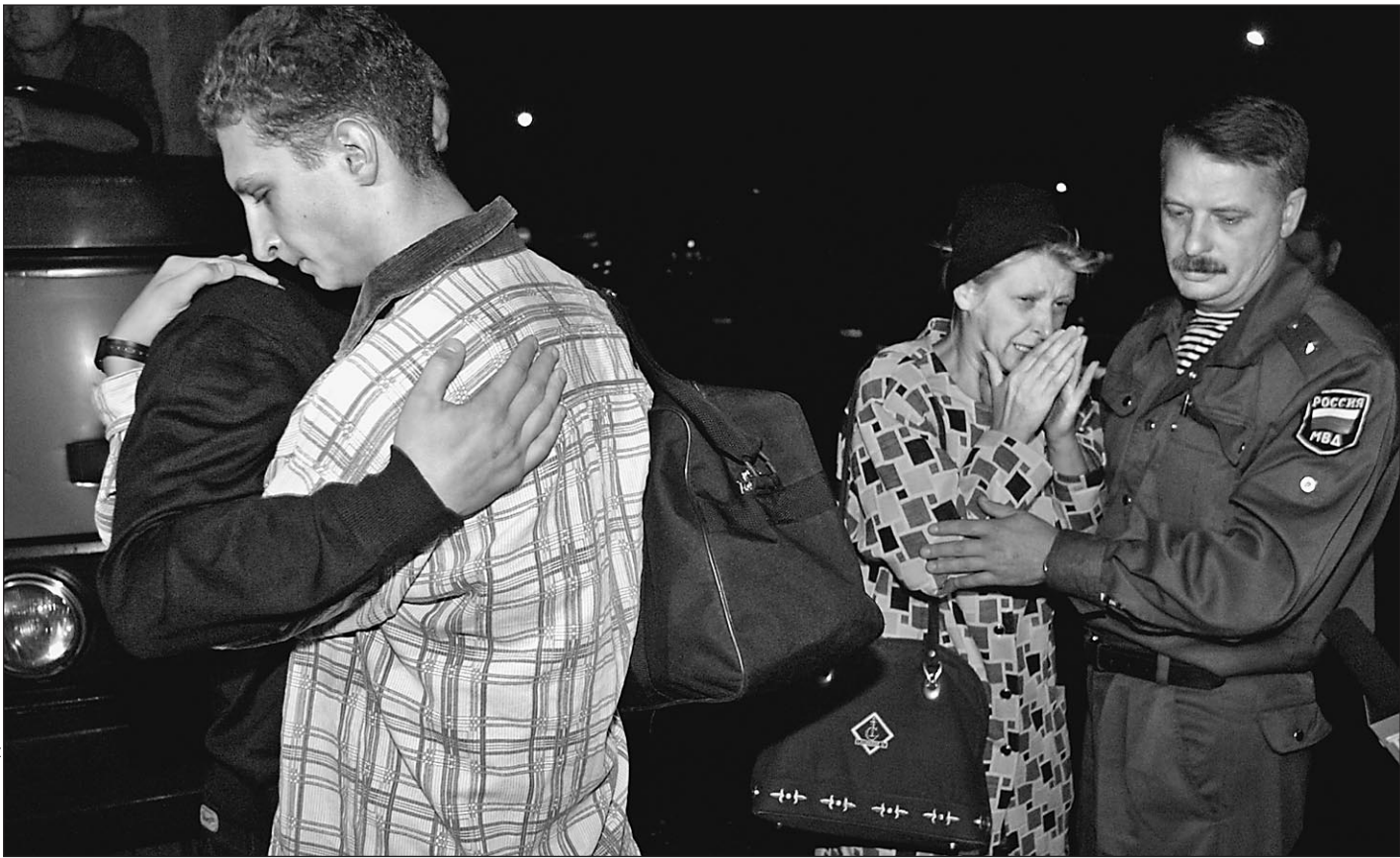
9 октября 2001 года. Родственники погибших в сбитом Украиной российском самолете Ту-154 съезжаются в Сочи

ны в Генпрокуратуру Украины, никаких дальнейших следственных действий по этому делу больше предпринято не было. В-третьих, первые судебные слушания по иску потерпевших в Украине в Печерском суде Киева показали, что это государство своей ответственности не признает, а ее официальные представители вовсе заявляют, что никакого попадания ракеты в российский самолет не было. Официальный Киев отрицает выводы межгосударственной комиссии Межгосударственного авиационного комитета, установившей, что самолет потерпел крушение в результате попадания ракеты ПВО Украины. Чего стоит заявление начальника Следственного управления Главного управления военных прокуратур Украины Валерия Журавеля, который подверг сомнению выводы коллег из авиакomiteта, не исключив, что на борту самолета произошел теракт! Но последней каплей стало распоряжение премьер-министра России Михаила Касьянова об оказании гуманитарной помощи жителям Украины, пострадавшим в результате катастрофы на авиашоу во Львове 27 июля. Распоряжение Касьянова предписывает Минфину выделить из резервного фонда правительства более $300 тысяч на эти цели. Родственники считают, что Межправительственная комиссия из представителей дипломатических ведомств России, Украины и Израиля справляется со своими организационными и переговорными функциями. Но для форсирования процесса урегулирования проблем необходимо вмешательство эффективных силовых институтов, в частности Генпрокура-