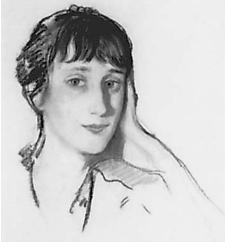
Такой увидела Анну Ахматову художница Зинаида Серебрякова. Петроград. 1922 год

Своих читателей-почитателей она, как все поэты, слегка недолюбливала. Но жить без них не могла. Миллионы людей знали наизусть строки про сероглазого короля, про устриц, которые «свежо и остро пахли морем», но навсегда исчезли из советского быта. Про перчатку с левой руки, про треуголку и томик Парни. Хотя почти никто этого Парни не читал. → стр. 10