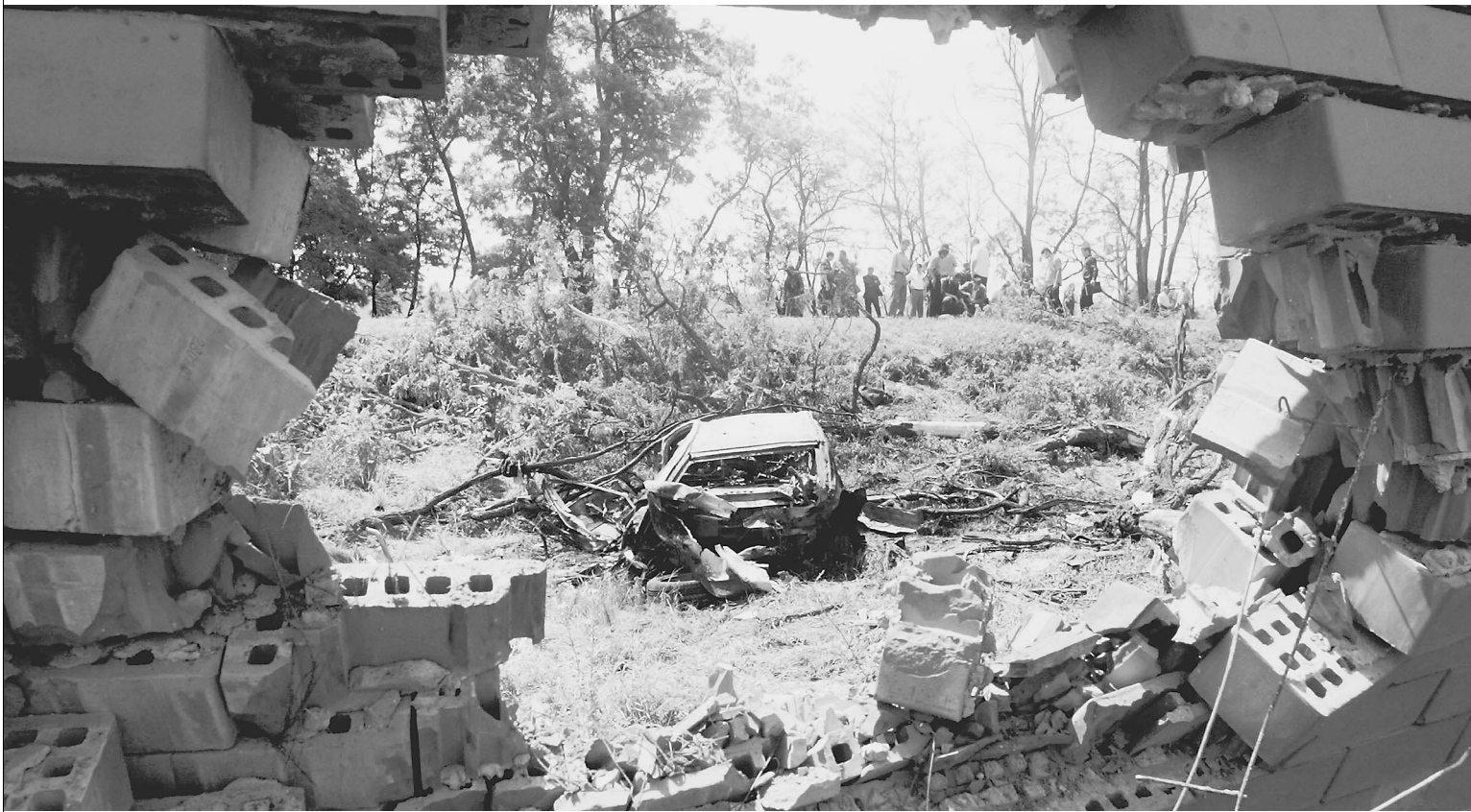
Террорист-смертник взорвал президента Ингушетии на ходу (на фото: то, что осталось от автомобиля Евкурова)