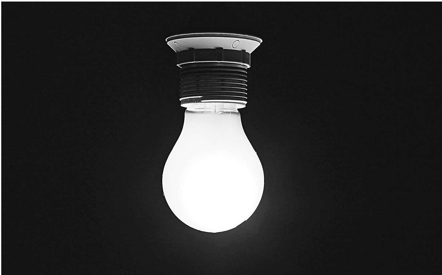
Пора от таких лампочек отказываться и переходить на энергосберегающие. Тарифы на электроэнергию выросли.