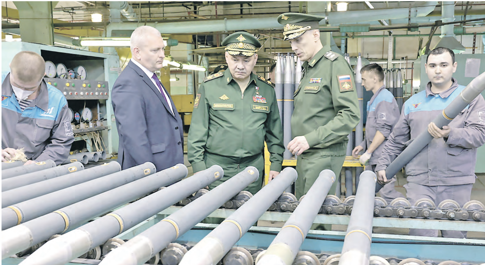
Министр обороны Российской Федерации генерал армии Сергей Шойгу на местах ознакомился с производством военной продукции

28 марта глава военного ведомства России в ходе рабочей поездки в Челябинскую и Кировскую области проверил ход выполнения предприятиями оборонно-промышленного комплекса (ОПК) государственного заказа. Генерал армии Сергей Шойгу проинспектировал производственные мощности предприятий, непосредственно задействованных в выпуске продукции военного назначения для обеспечения специальной военной операции по демилитаризации и денацификации Украины.