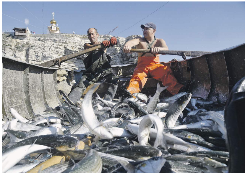
Александр Погосович | Известия