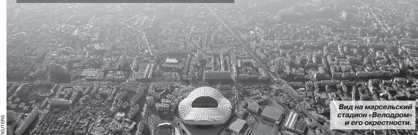
Вид на марсельский стадион «Велодром» и его окрестности.