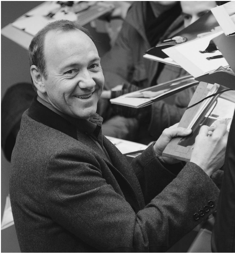
АКТЕР КЕВИН СПЕЙСИ НА ПРЕДСТАВЛЕНИИ ФИЛЬМА «MARGIN CALL»

В числе претендентов на победу фильм «Margin Call» — о финансовом кризисе 2008 года. В ролях — Деми Мур, Кевин Спейси, Джереми Айронс, Пол Беттани, Стенли Туччи →09