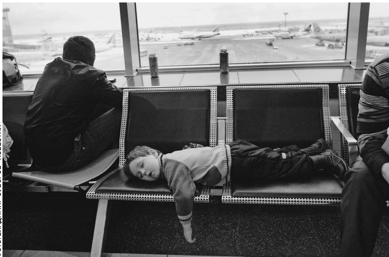
ТАК КОРОТАЛИ ДНИ ПАССАЖИРЫ ВО ВРЕМЯ ДЕКАБРЬСКОГО АВИАКОТЛАПСА