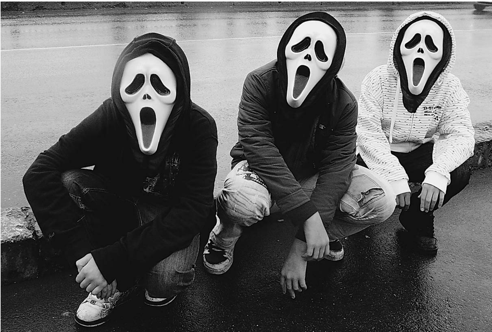
Не каждому под силу сделать правильный выбор в «трудном» возрасте

С нового учебного года вводится тестирование подростков на наркозависимость