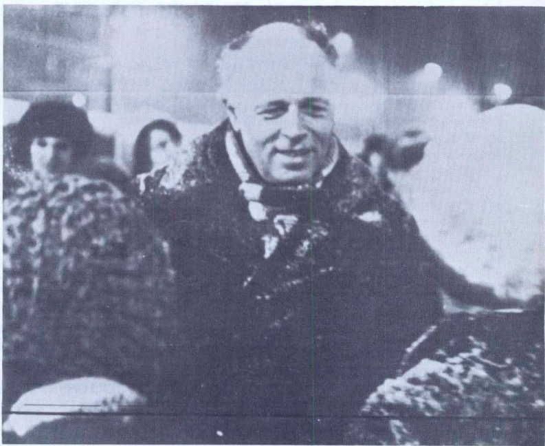
А. Д. Сахаров: «Обращаюсь ко всем, озабоченным страданиями людей и защитой справедливости»

ЕЖЕМЕСЯЧНЫЙ ОБЩЕСТВЕННО-ПОЛИТИЧЕСКИЙ ЖУРНАЛ