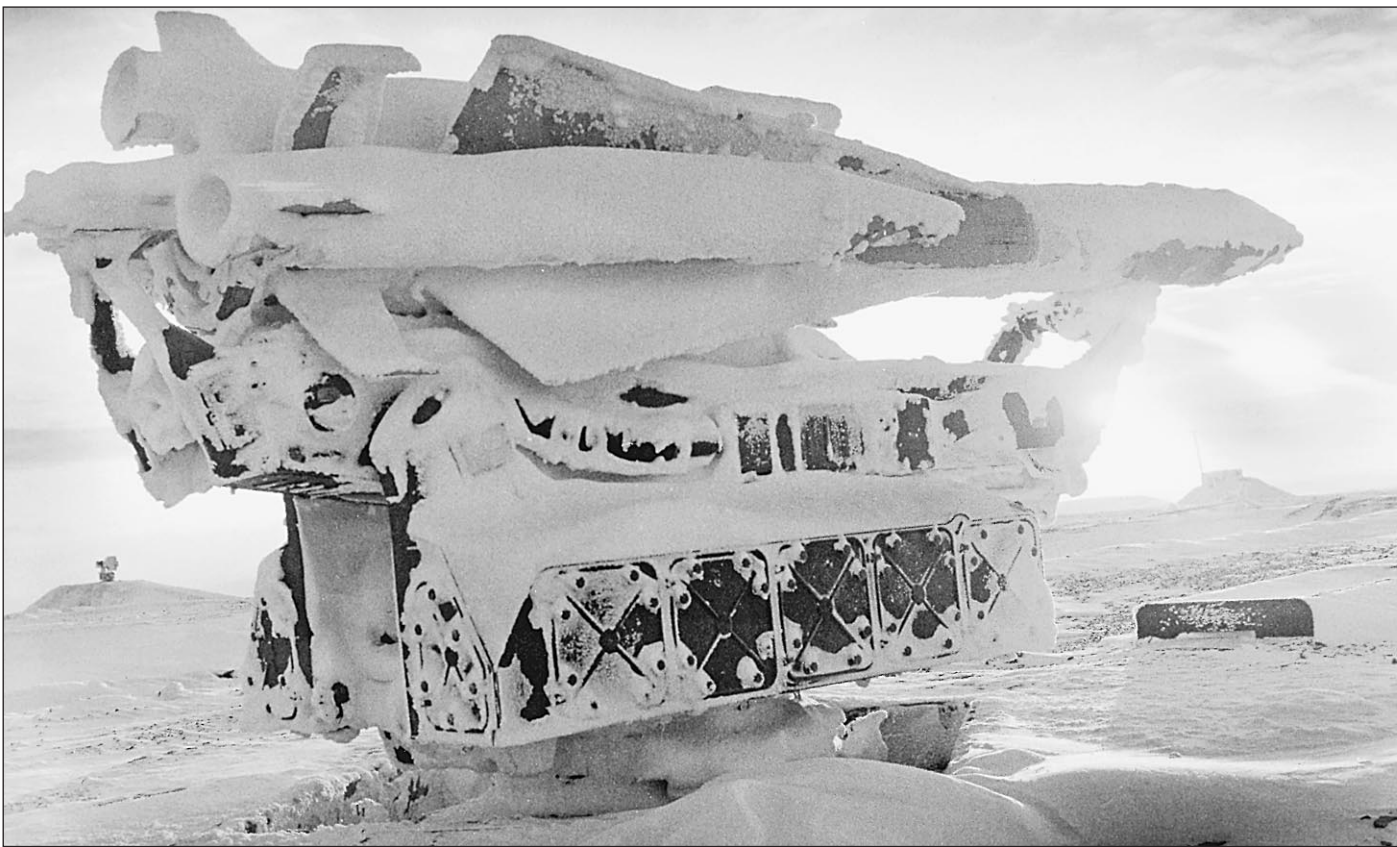
Противоракетная отпелль кончилась. Начинаются заморозки