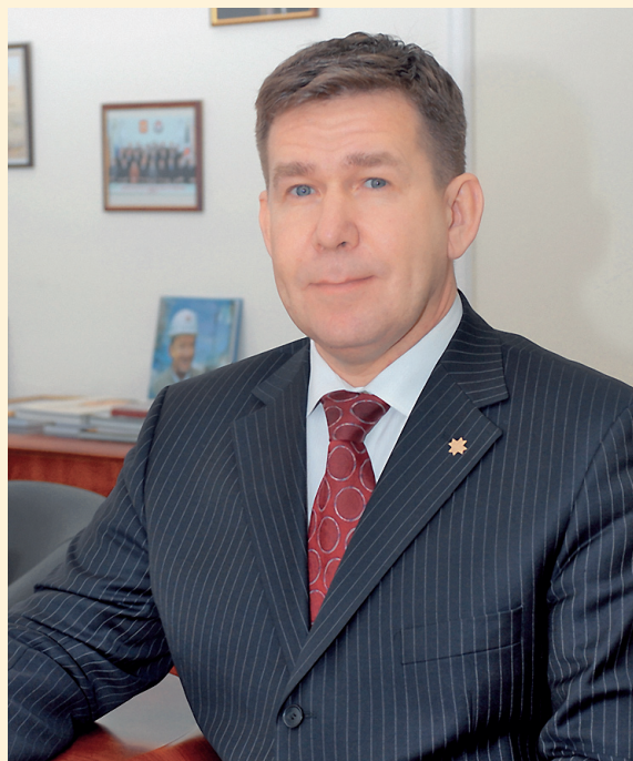
БИКБУЛАТОВ Ильдар Ильшатович, заместитель Председателя Правительства Удмуртской Республики