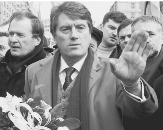
Киев. Виктор Ющенко еще не кандидат в президенты, но уже лидер оппозиции

Виктор Ющенко — настоящий демократ, с его приходом к власти Украина станет цивилизованной европейской страной