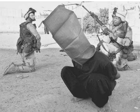
Ирак. Американцы задерживают очередного «террориста»

Саддам Хусейн имеет оружие массового поражения. И лишь вторжение в Ирак может спасти мир от страшной угрозы