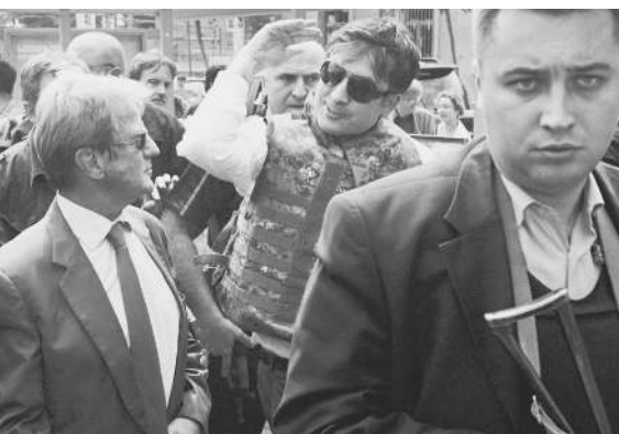
Гори. Михаил Саакашвили и глава МИД Франции Бернар Кушнер приехали на передовую

Россия совершила агрессию против Грузии, Михаил Саакашвили не начинал первым боевые действия