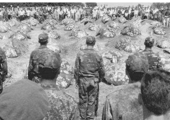
Косово. «Борцы за свободу края» на могилах своих погибших соотечественников

В Косово сербы совершают преступления против человечества, а албанцы борются за свободу