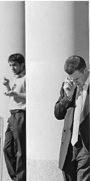
Европейский стандарт передачи номеров не стал для нас родным