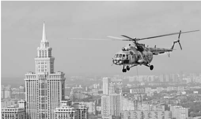
Ми-8 много лет служил верой и правдой в самых разных качествах

Такая рекомендация связана с результатами расследования трех катастроф вертолетов Ми-8Т — в феврале 1998 года, в июле 2008 года и в ноябре 2010 года. Во всех трех случаях были человеческие жертвы из-за разрушения турбин двигателей, образования пробоев в потолочной панели кабины вертолета и попадания фрагментов двигателей и продуктов горения в салон. То есть независимо от того, что стало причиной катастрофы, отсутствие защиты салона вертолета во всех трех случаях стало дополнительным фактором, приведшим к трагическим последствиям.