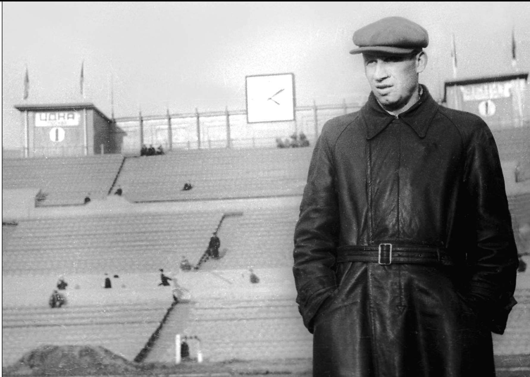
Конец 40-х годов. Москва. Стадион «Динамо». Большинство из своих 141 гола Григорий ФЕДОТОВ забил именно на стадионе в Петровском парке.

Сегодня первое заседание клуба (стр. 3). Приглашаю. И не только почитать, но и по diskutieren.