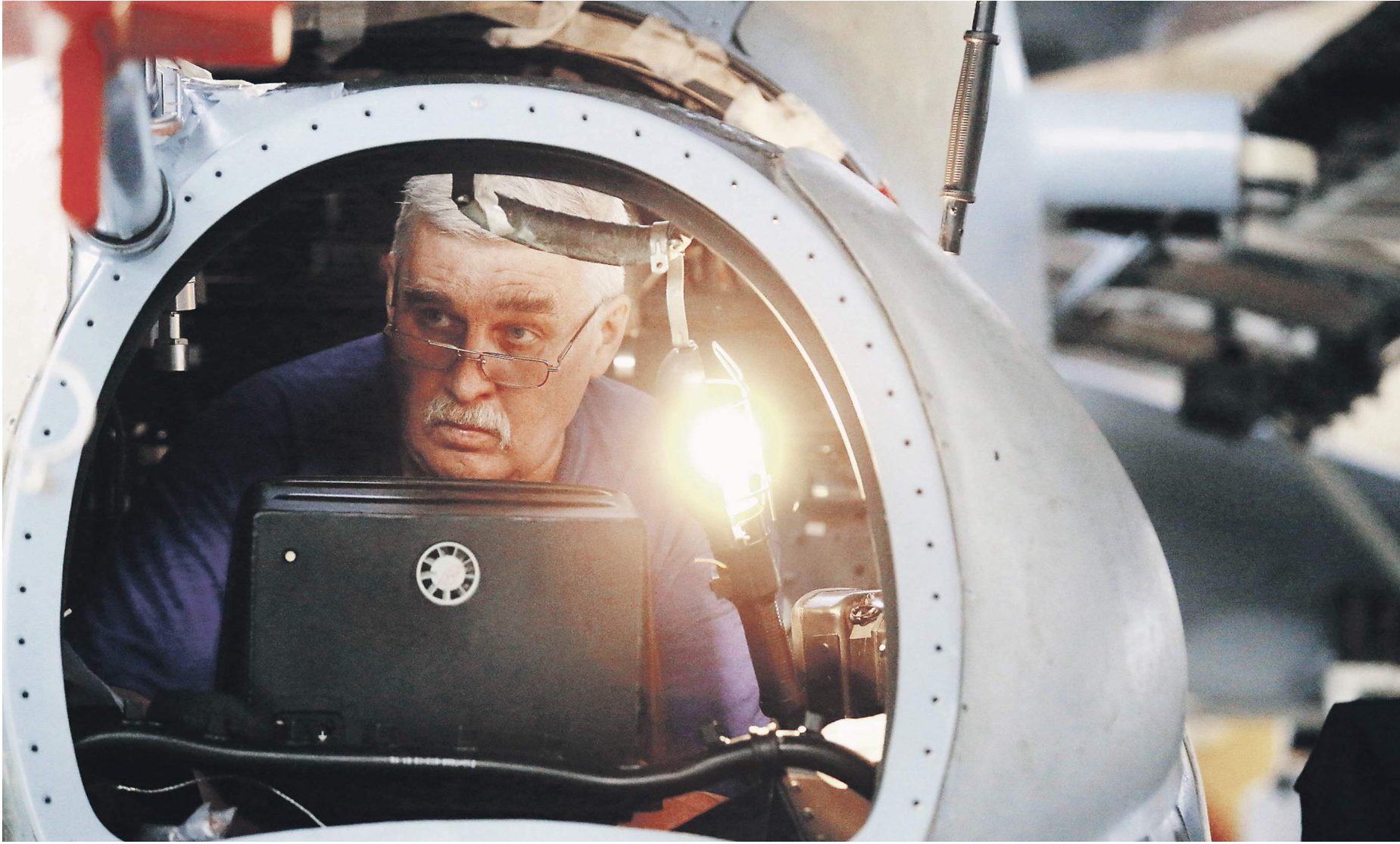
Для многих людей седьмой десяток — не препятствие для плодотворной работы

Правительство разрабатывает план включения в экономику людей старшего поколения