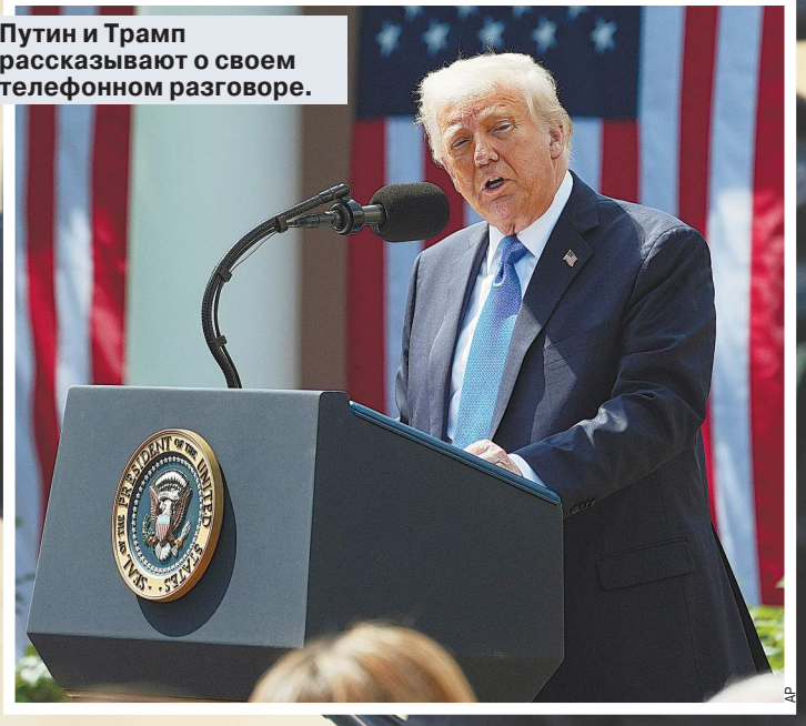
Путин и Трамп рассказывают о своем телефонном разговоре.